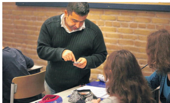
Maar 11 procent van de leerlingen uit het klassikale onderwijs vindt dat het tempo van de lessen aansluit op zijn niveau, blijkt uit onderzoek.